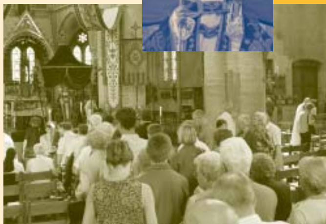
Verering Leonardusrelikwie op Pinksteren.