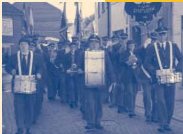
De fanfare van Zoutleeuw, traditiegetrouw op kop, tijdens de 11 november optocht.

SP.a Zoutleeuw, SVV & vzw Vooruit: 16 de eetfestijn in Zonnegroen, St.-Truidensesteenweg 44, Zoutleeuw vanaf 17u tot 21.00 u.