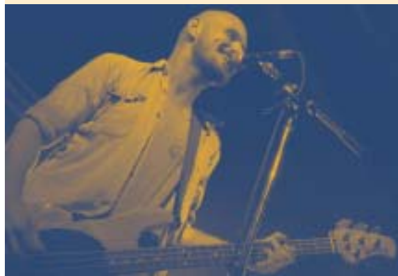
Stevige rock en veel ambiance met 'Camden' en 'Bacon Fat' in De Passant (PAL)