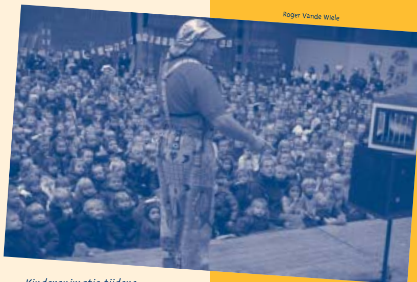
Kinderanimatie tijdens het bezoek van de Sint op 6 december - De Passant

KVLV Dormaal: "Koken", seizoensgerechten in het kostershuis om 19.30u.