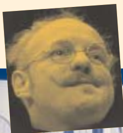
'Stil, zeg ik ...!' Gezellen van Vliebergh - december 2002